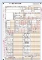
■ 法人事業概況説明書(2枚)