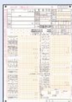
■ 確定申告書別表一(1枚)

対象月の属する月の前事業年度の分を提出してください。 ※少なくとも、確定申告書別表一の控えには収受日付印が押されていること。