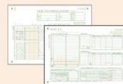
■ 所得税青色申告決算書(2枚)